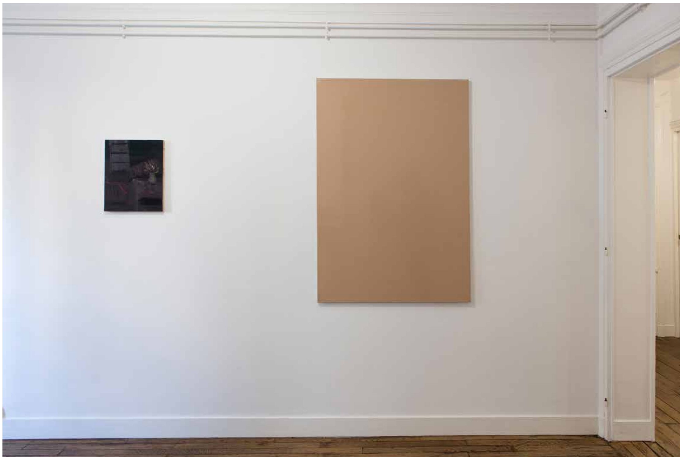
Vue de l'exposition Casual affair , Paris 2018