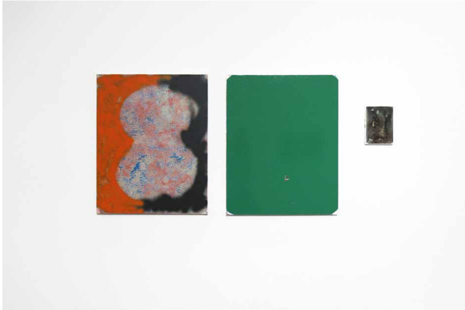
Vues de l'exposition Le pas de l'embusqué Centre d'art contemporain Les Capucins, 2016