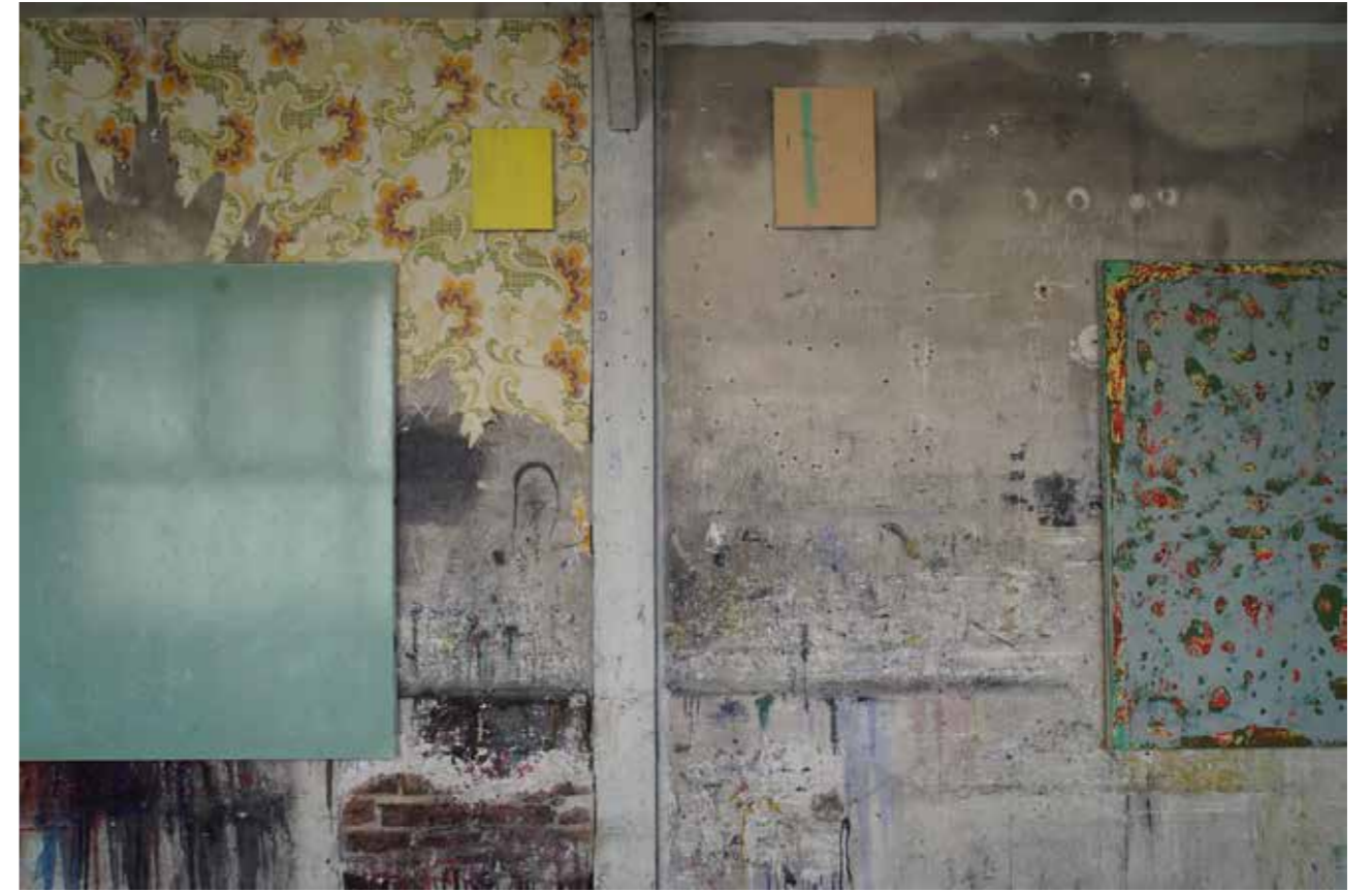
Vue de l'exposition Cabaret pasteur Bagnolet 2018