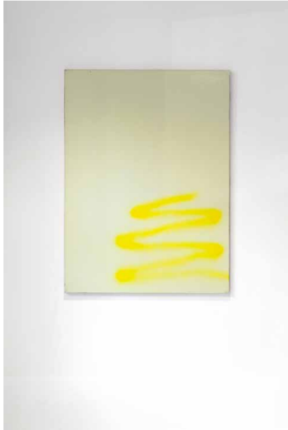
Sunset 2016-2018 Peinture glycérophtalique et aérosol sur toile 81 x 60 cm