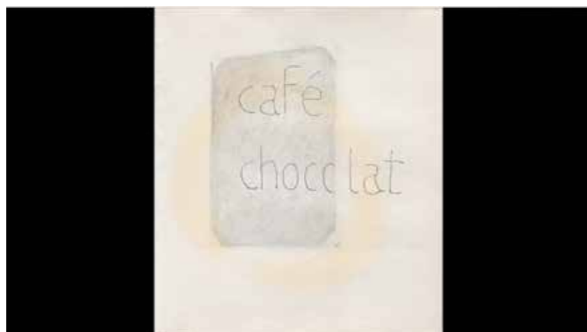
Café chocolat 2019 Montage - diaporama numérique, à partir du carnet : Extraits 2016-2019.. Durée 1 min 17