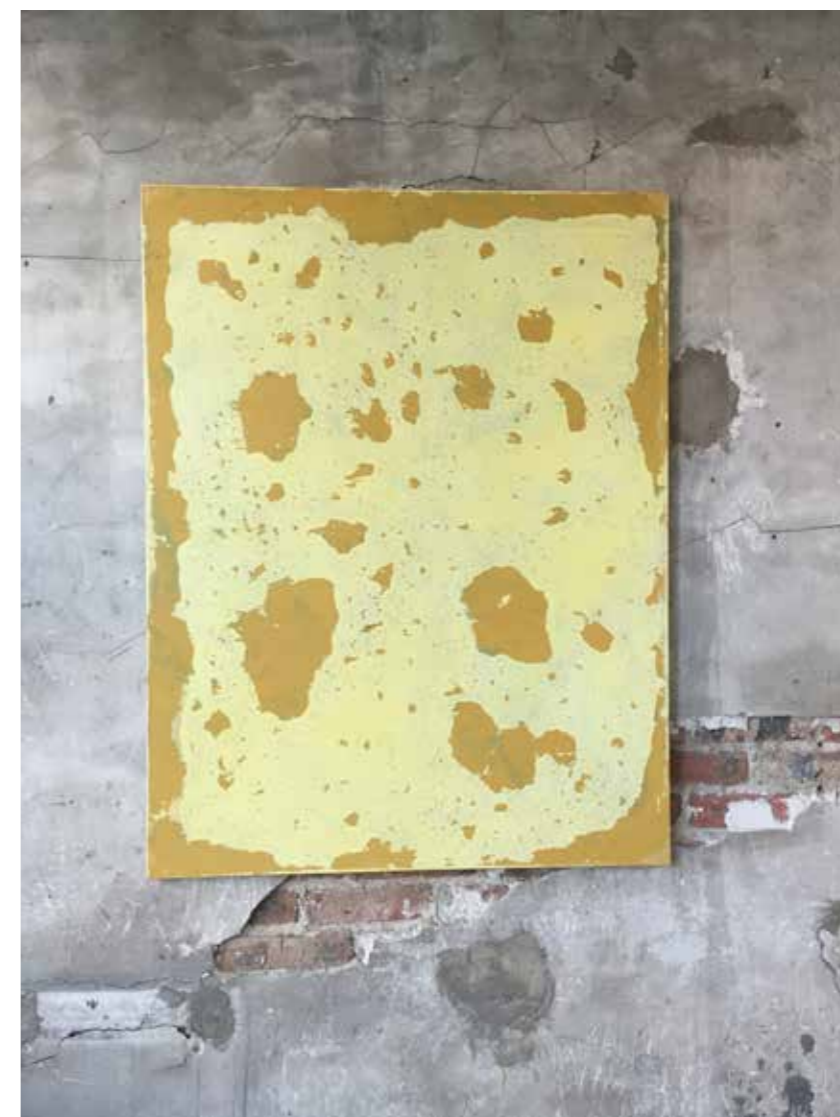
Eponge 2016-2017 Peinture glycérophtalique et vinylique sur toile 116 x 90 cm

Vue de l'exposition Cabaret pasteur Bagnolet 2018