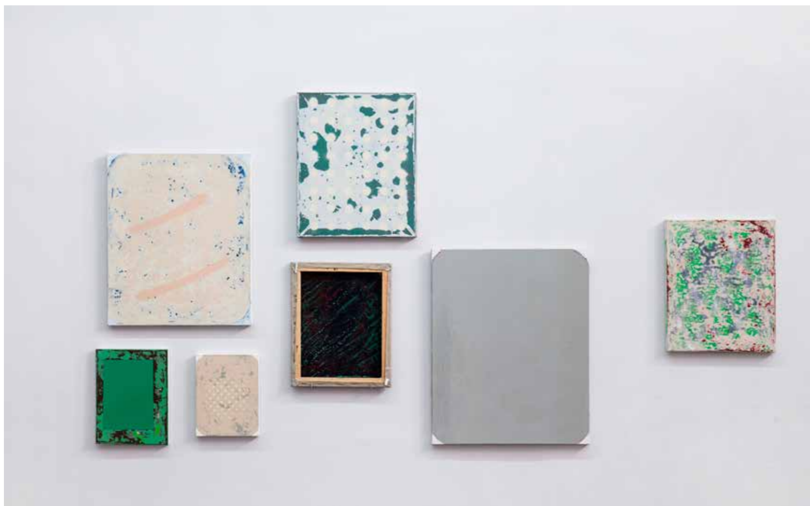
Vues de l'exposition Le pas de l'embusqué Centre d'art contemporain Les Capucins, 2016