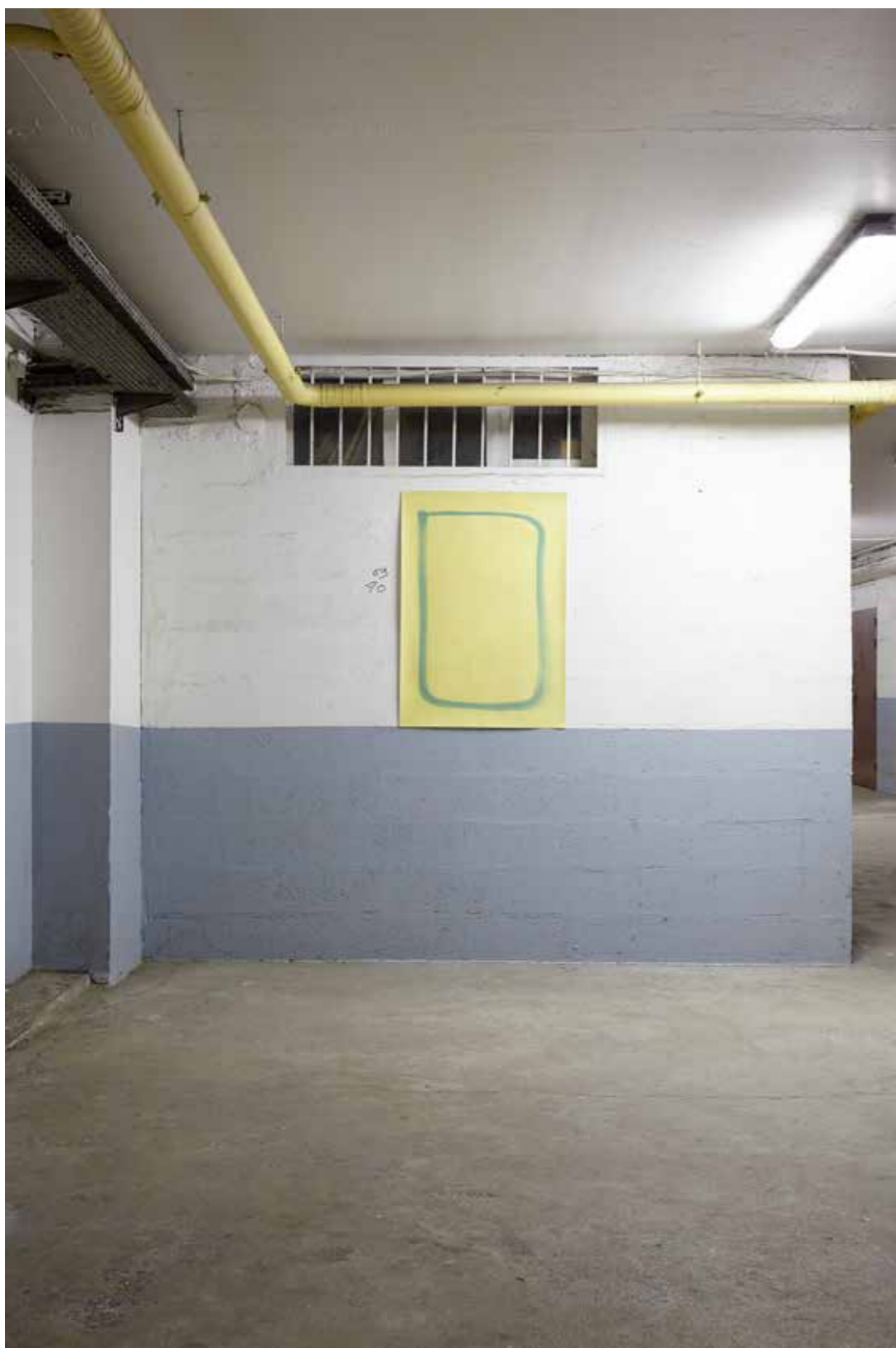
Vue de l'exposition Tes habitacles , Roussin, Paris, 2019