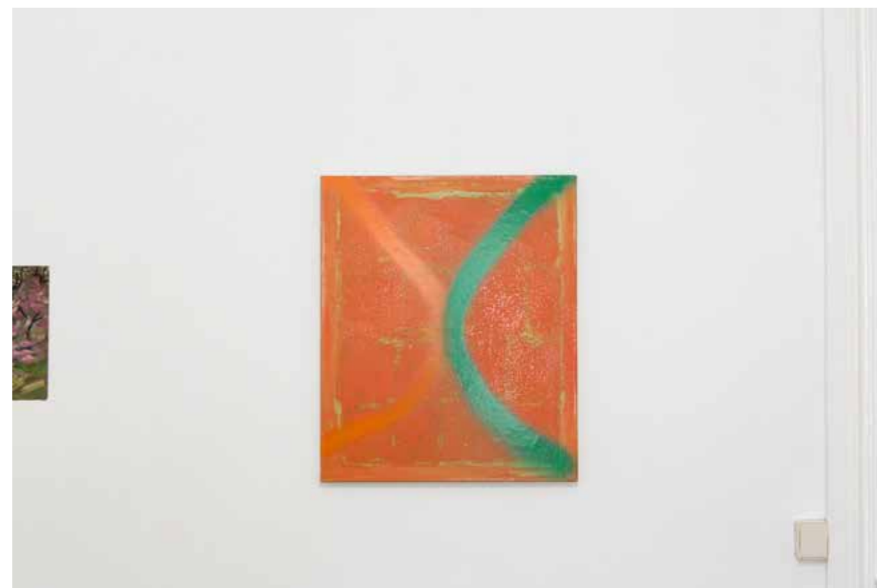
Aérosol bleu 2016-2018 Peinture glycérophtalique acrylique et aérosol sur toile 33 x 22 cm