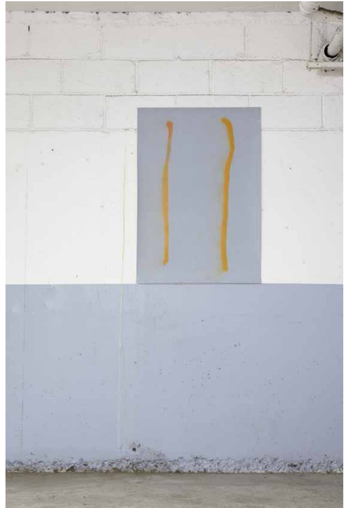
Vue de l'exposition Tes habitacles , Roussin, Paris, 2019