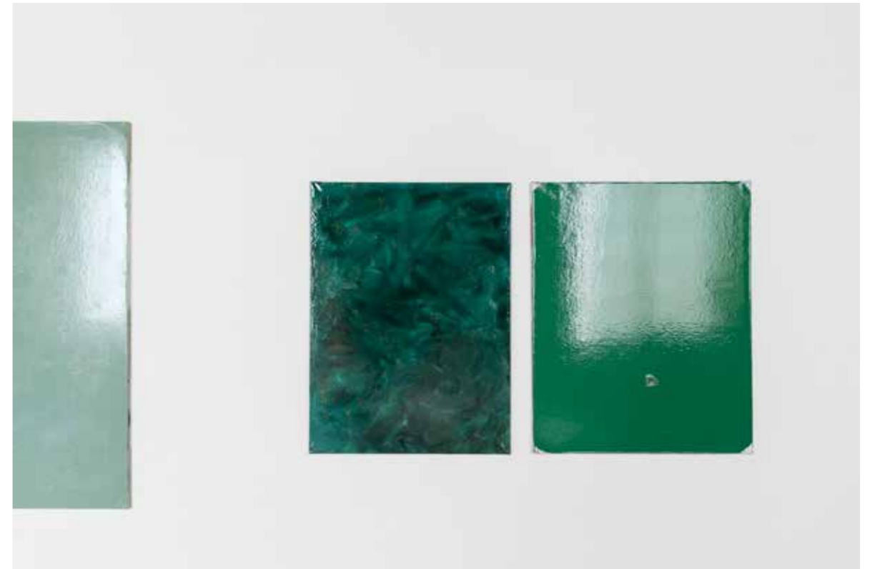
Vue de l'exposition Temps mêlés , Orangerie de Sucs-en-Brie 2020