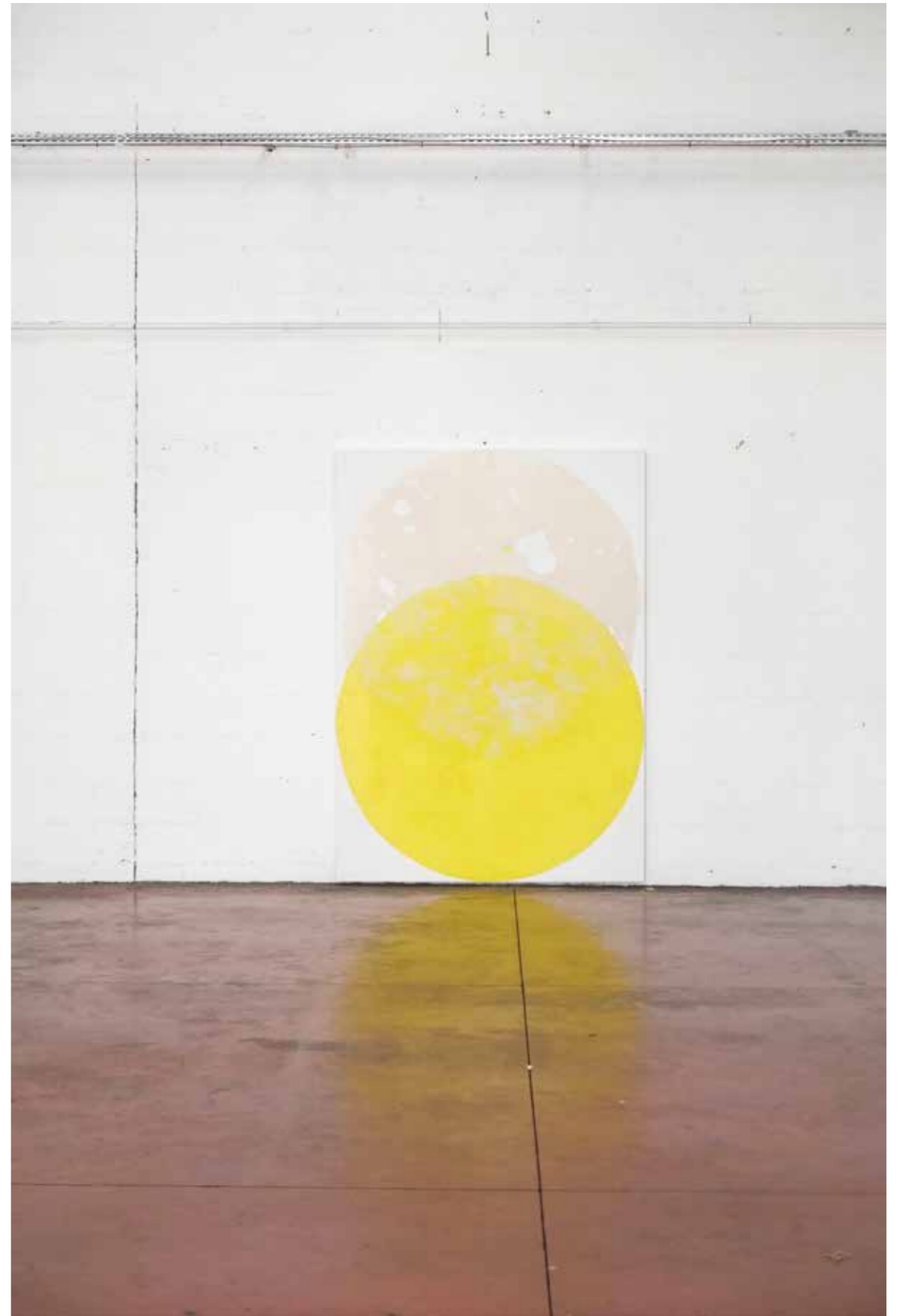
Avec et contre 2017 Peinture glycérophtalyque sur toile 210 x 150 cm

Vues de l'exposition Les jours de pleine lune #3 , La Tôlerie, espace municipal d'art contemporain, Clermont-Ferrand 2017