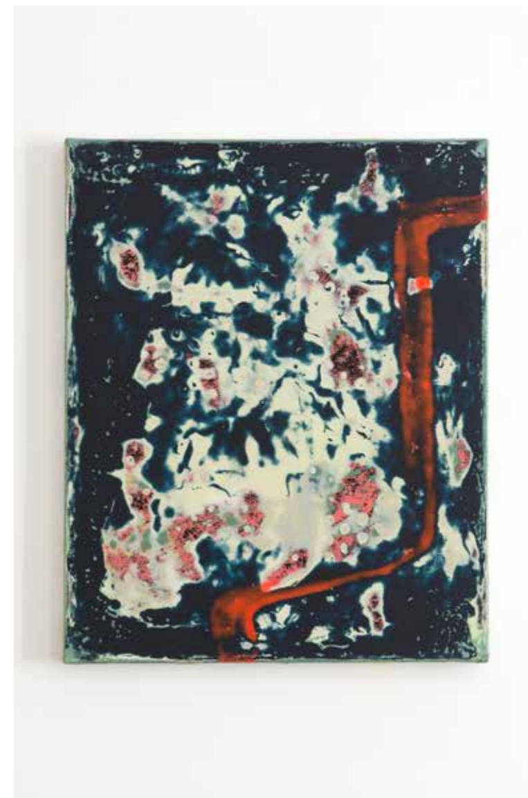
Trait rouge 2009-2018 Peinture glycérophtalique et acrylique et aérosol sur toile 41 x 33 cm

Vue de l'exposition Casual affair , Paris 2018