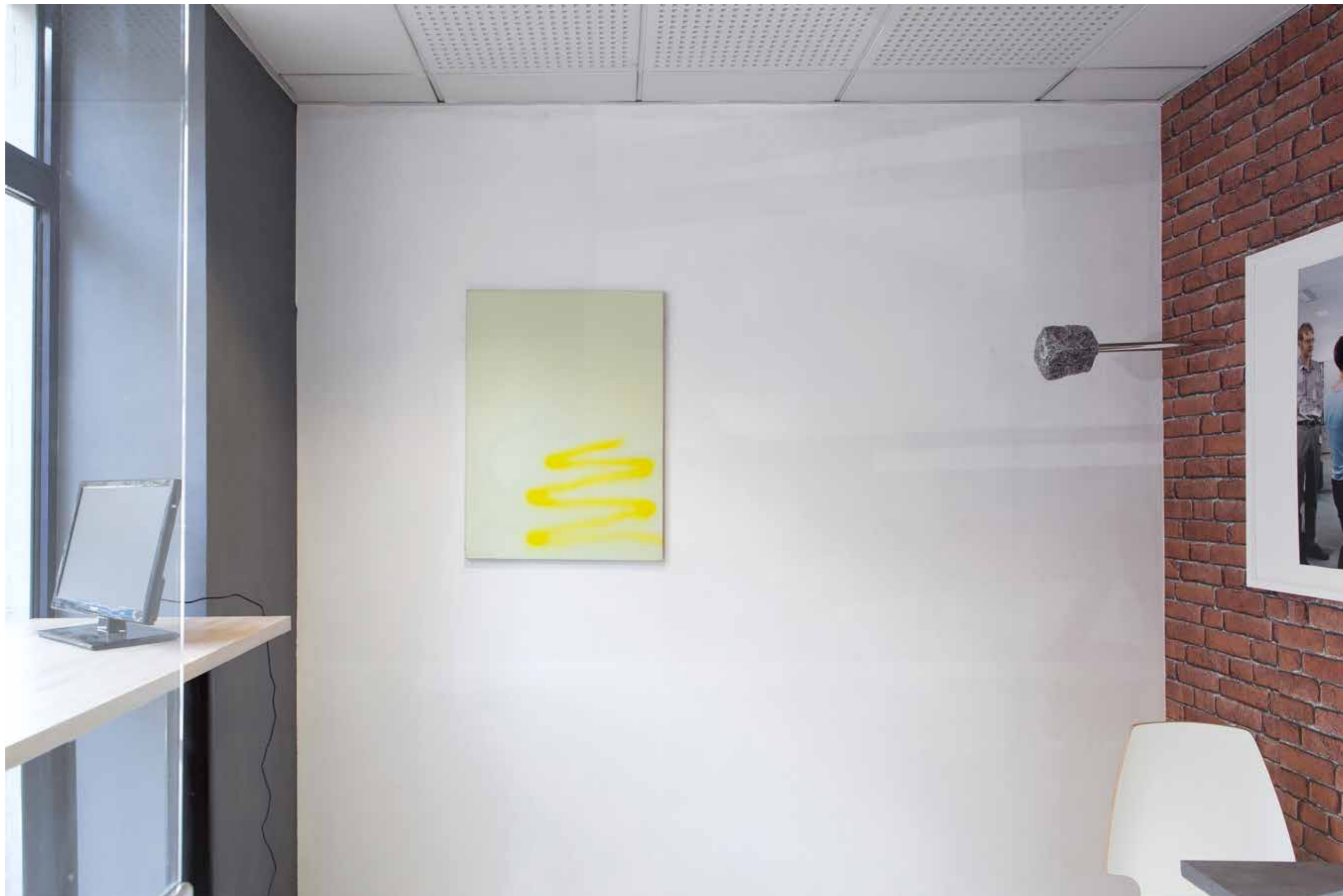
Vue de l'exposition City life 2 City café, Paris 2018