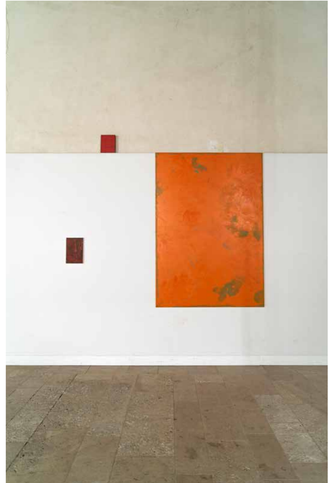
Vue de l'exposition Temps mêlés , Orangerie de Sucy-en-Brie 2020