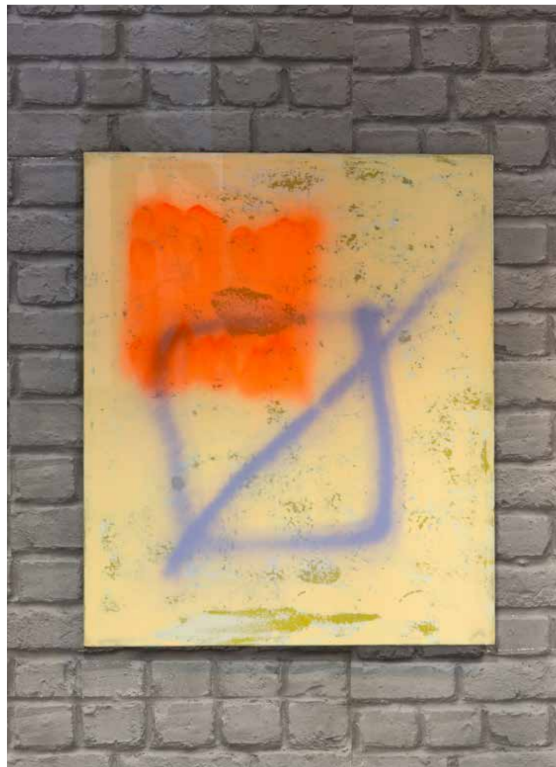
Carré barré 2016-2018 Peinture glycérophtalique et aérosol sur toile 65 x 54 cm

Vue de l'exposition City life 2 City café, Paris 2018