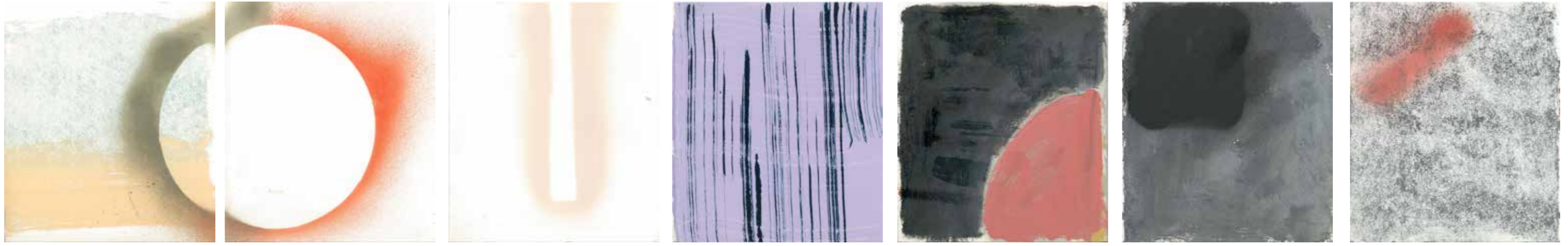
Extraits 2016-2019.. Techniques mixtes Carnet 21cm x 21cm