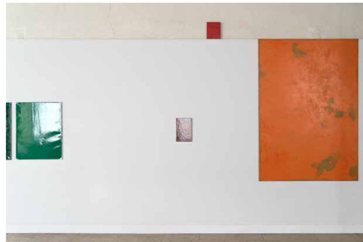
Vue de l'exposition Temps mêlés , Orangerie de Sucs-en-Brie 2020