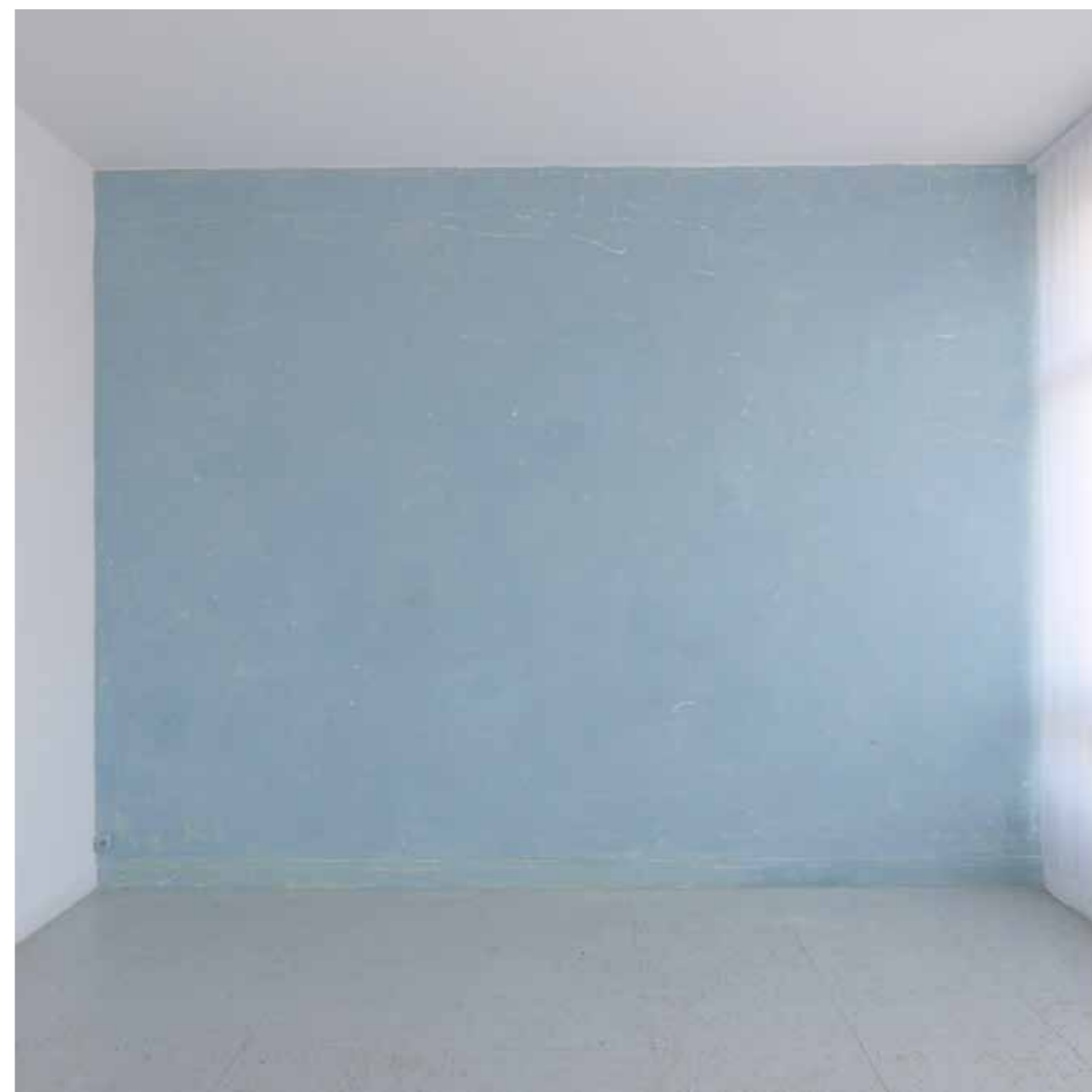
Comme le son d'une cloche apporté par le vent, Espace d'art contemporain Camille Lambert, Juvisy-sur-orge 2019