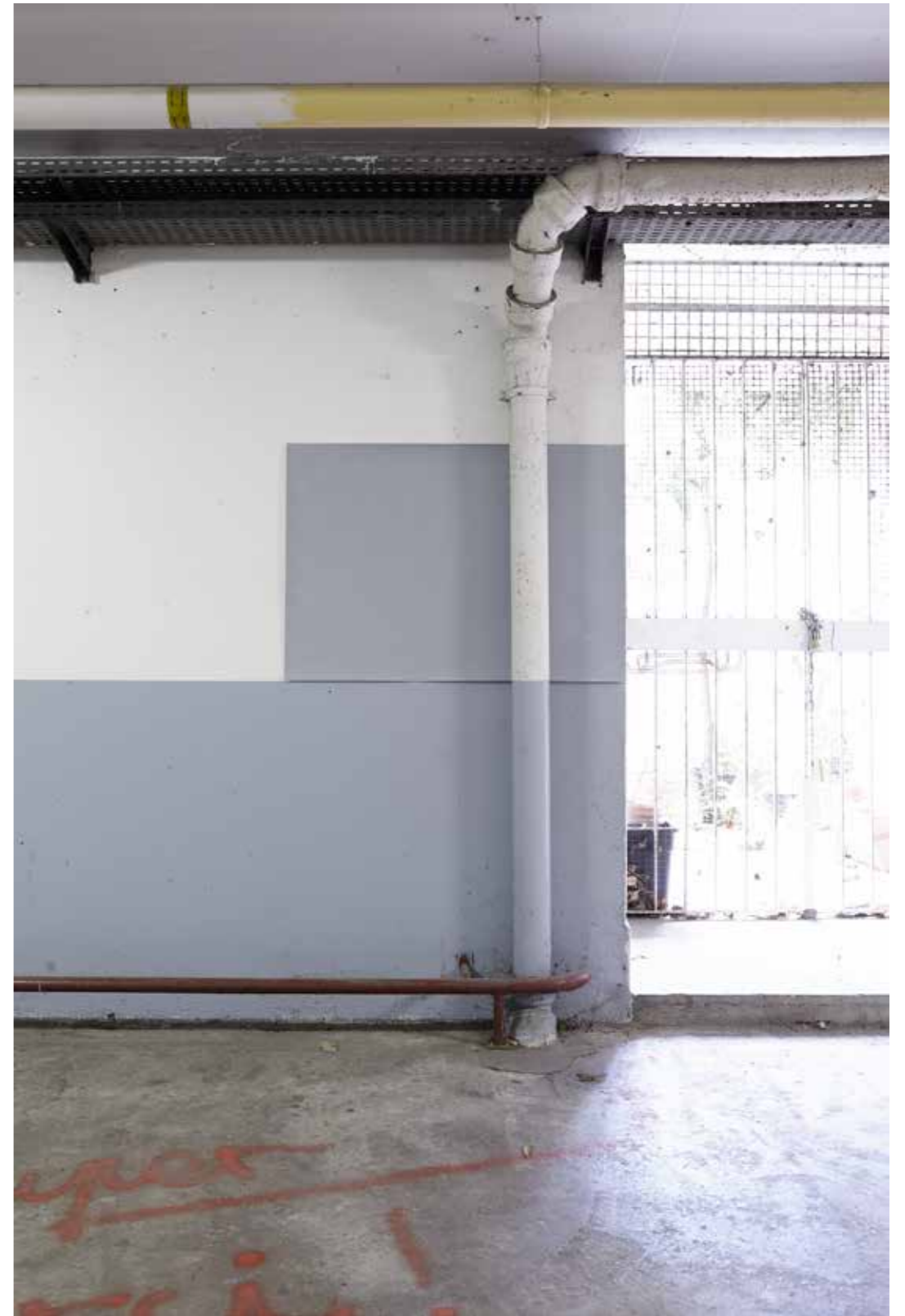
Vue de l'exposition Tes habitacles, Roussin, Paris, 2019